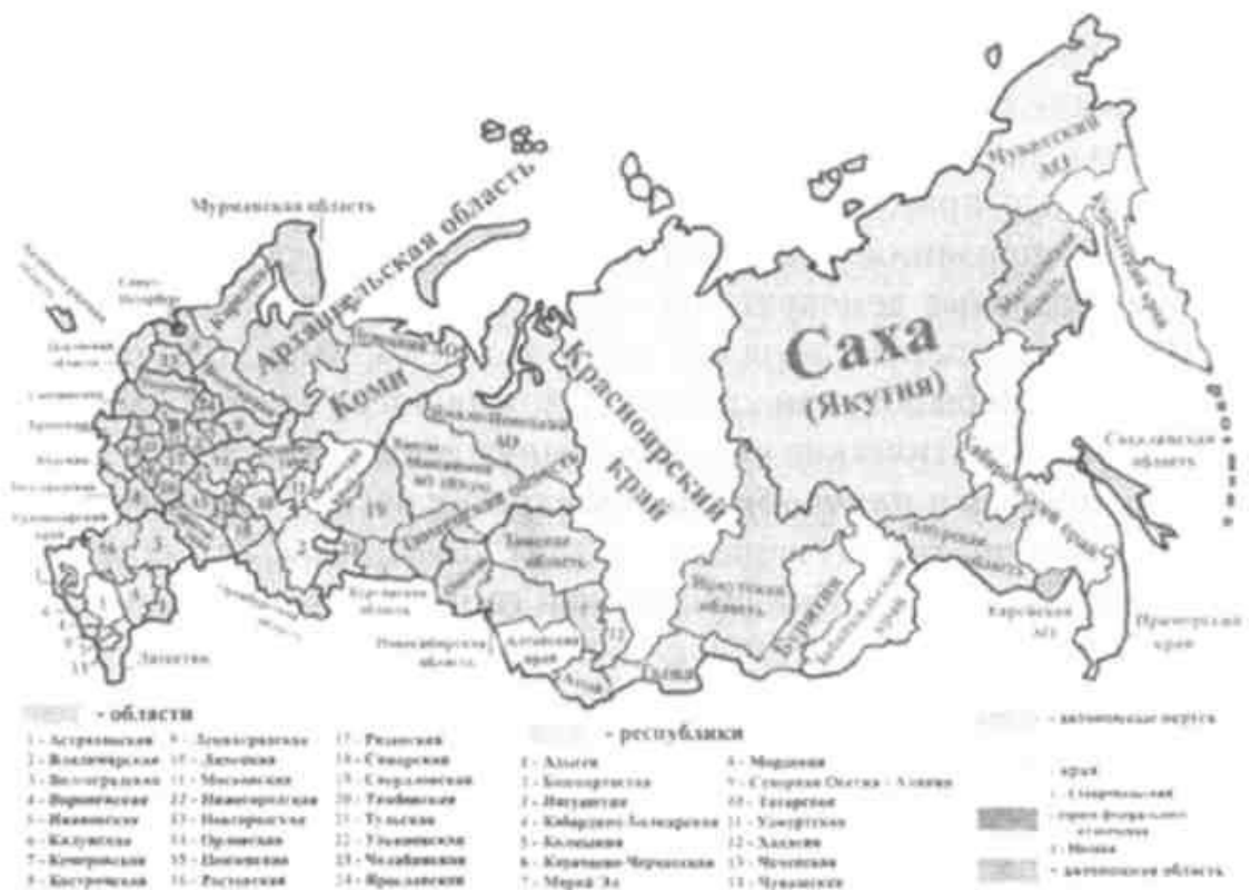
Рис. 3. Федеративное устройство России

Однако более серьезным фактором изменений национального состава России стал распад СССР в 1991 г. Крушение огромного многонационального государства, каким был Советский Союз, вызвало массовые миграции населения, экономические и политические трансформации в самой России и в возникших новых государствах. Экономические и политические реформы породили безработицу, потоки беженцев, этнические и культурные противоречия.