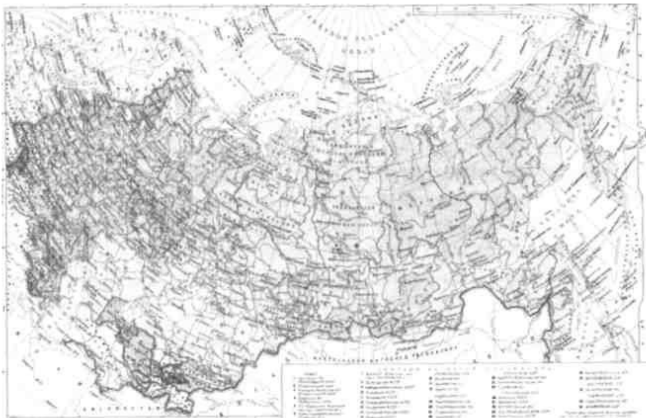
Рис.1. Карта СССР

На территории СССР проживало 288 млн человек (на 1989 г.), обеспеченных одной из самых всеохватывающих систем образования в мире. Существовала развитая система социальной поддержки