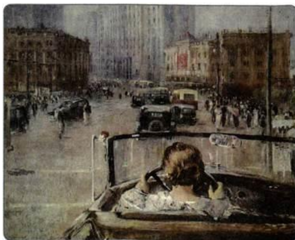
Рисунок 1. Новая Москва. Художник Ю. И. Пименов

Задание 12. Рассмотрите репродукцию картины художника Ю.И. Пименова «Новая Москва».