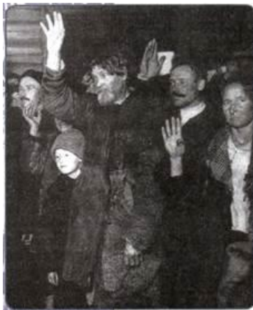
Рисунок 1. Голосование крестьян за вступление в колхоз