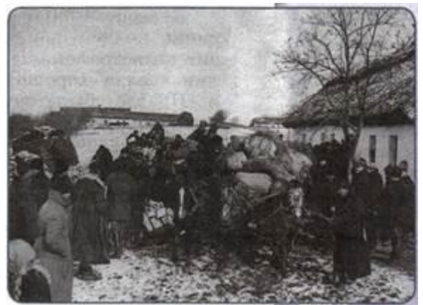
Рисунок 2. Высылка раскулаченных