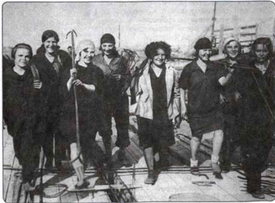
Рисунок 2. Женская строительная бригада. 1931 г.

Представьте, что вы и ваш сосед по парте — корреспонденты советской газеты «Труд». Ваша задача — написать для неё небольшую заметку, иллюстрацией к которой является данная фотография. Придумайте название статьи. Напишите 5-6 предложений.