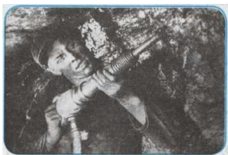
Рисунок 1. _____

Задание 3. Используя содержание пункта 3 § 15, а также дополнительные источники, выполните задание.