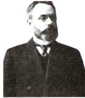
Военный министр и временно морской министр, член Гос. совета