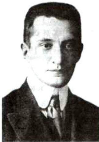
Министр юстиции, депутат Гос. думы