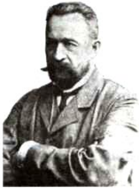
Председатель Совета министров с портфелем министра внутренних дел, князь