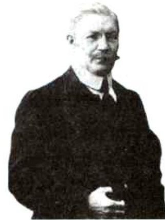
Министр иностранных дел, депутат Гос. думы

Задание 5. Охарактеризуйте политику Временного правительства с позиции: а) успехов его деятельности (т.е. мероприятий, вызвавших одобрение населения) и б) просчётов (т.е. мероприятий, вызвавших недовольство населения).